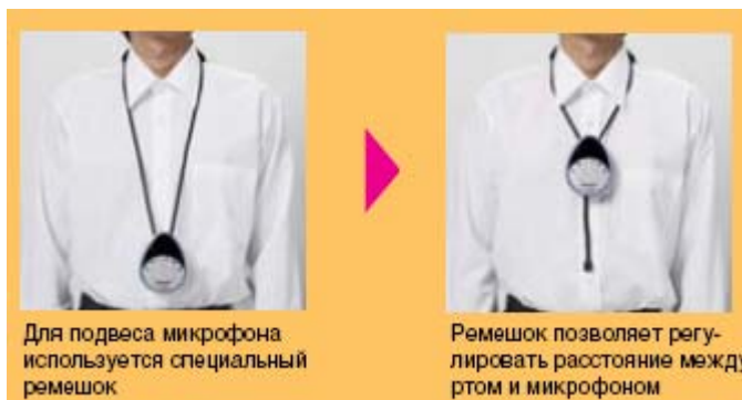
Для подвеса микрофона используется специальный ремешок

На микрофоне WX-LT310E имеются кнопки управления громкостью звука, что дает возможность контроля громкости звука у самого пользователя или у другого оратора. На одном и том же приемнике можно управлять двумя каналами с помощью переключателя MIC SELECT (OWN/OTHER).